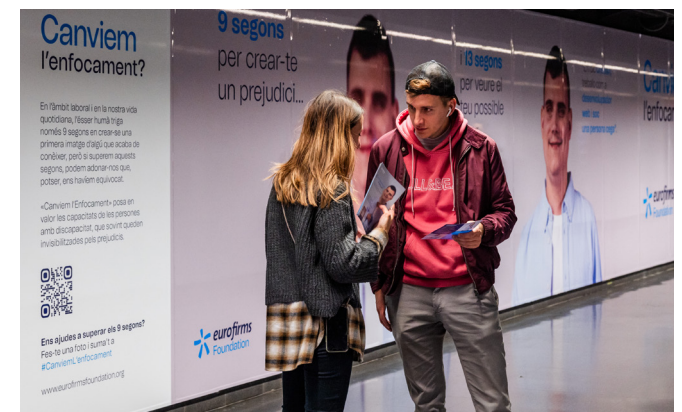
Imatge de l'exposició " Canviem l'enfocament ".