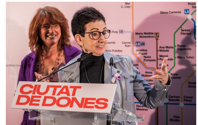
Imatge de l'exposició "Ciutat de Dones".