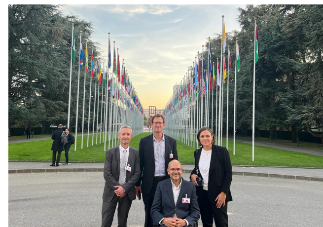
Imatge de la presentació a la Comissió econòmica per Europa de les Nacions Unides.