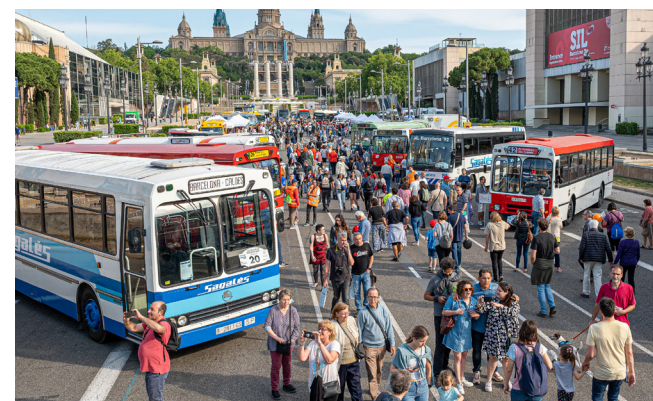
Imatges de l'exposició d'Autobusos Clàssics Barcelona.