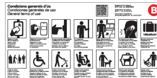
Nou disseny de senyalització a bord bus.