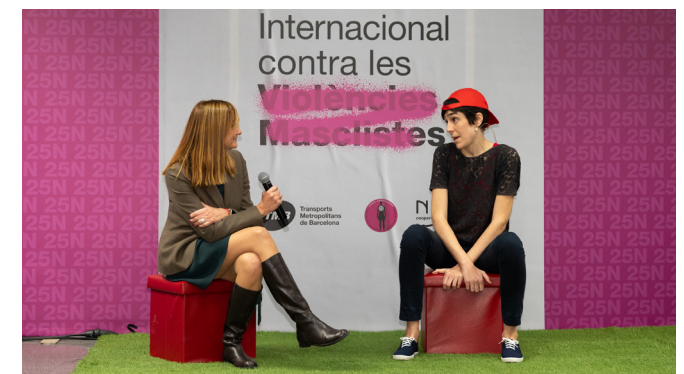
Imatge de l'activitat al vestíbul de l'estació Universitat pel Dia Internacional contra la Violència Masclista.