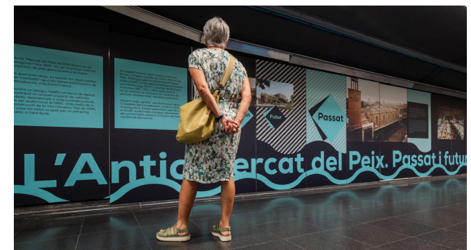
Imatge de l’exposició “ Antic mercat del peix: passat i futur ” a l’estació de metro de l’L4 Ciutadella-Vil·la Olímpica.