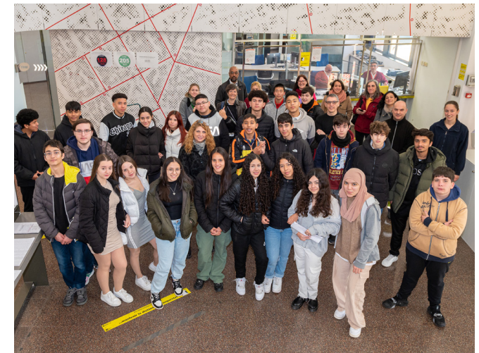
Visita dels estudiants de 4rt d'ESO de l'Institut Turó de Roquetes al CON de Triangle.