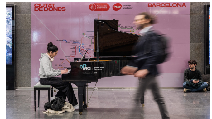
Imatge del vestíbul de metro de Diagonal d’una de les actuacions del festival internacional Maria Canals.