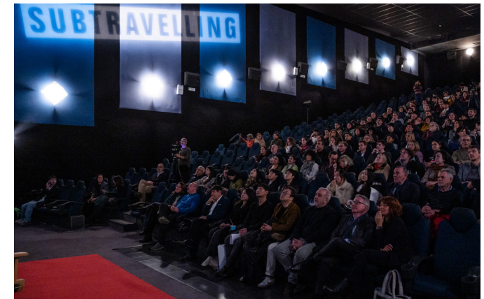
Imatge de l'acte de lliurament de premis "Seoul Metro International Subway Film Festival" (SMIFF).

V. Música al Metro: S'han incorporat 10 nous punts de música en viu a la xarxa de metro, i actualment s'arriba a un total de 52, per tal que persones de l'Associació de Músics de Carrer (AMUC) puguin disposar d'un espai públic per interpretar els seus repertoris i, alhora, contribuir a una experiència de viatge més acollidora i agradable. El 17 de març s'organitza una nova edició de proves d'ideïtat, per a la captació de talent, fruit de la qual van superar les proves 45 nous músics. El 21 de juny, coincidint amb el Dia Europeu de la Música, s'ofereix una mostra conjunta de música en viu a l'estació de metro Diagonal per posar en valor la tasca d'AMUC a la xarxa de metro. Finalment, el 16 de desembre, al vestíbul de metro d'Universitat té lloc una nova edició del festival "Música al metro", amb una quarantena actuacions en directe durant tot el dia, a càrrec d'artistes de l'AMUC.