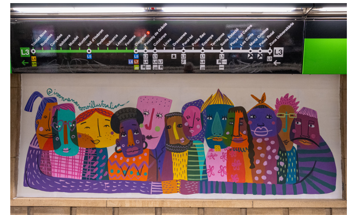
Imatge del mural guanyador del primer premi del concurs " Murals per la pau ".

IV. Murals a la xarxa de metro, amb la col·laboració de Justícia i Pau: Les tres obres guanyadores del concurs " Murals per la pau " llueixen des del mes d'abril a les andanes de l'estació Diagonal L3, tot reivindicant l'art com a eina de transformació social.