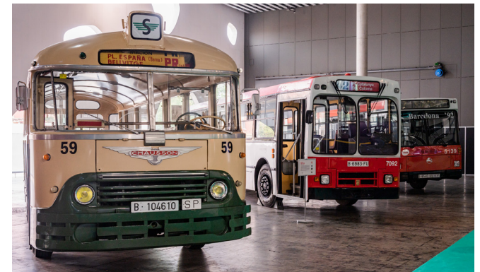
Imatges de vehicles històrics a l'UITP Global Public Transport Summit.