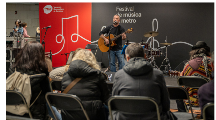
Imatge del festival "Música al metro" al vestíbul de metro d'Universitat.