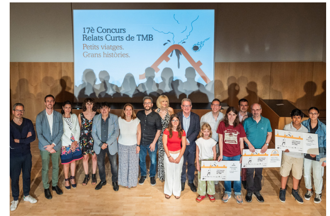
Imatge de l'acte d'entre de premis del 17è Concurs de Relats Curts de TMB.

II. Concurs de Relats Curts de TMB (17a edició) . El mes de febrer s'inicia la campanya de difusió d'aquesta iniciativa, amb una nova col·laboració amb Biblioteques de Barcelona i la xarxa de biblioteques de la Diputació de Barcelona, amb un nou enfocament de fomentar més la participació i la creativitat entre els centres educatius, els infants i els joves. S'hi han presentat un total de 1.291 relats, el que representa un 66% més de participació respecte de l'edició anterior. L'acte de lliurament de premis se celebra el 20 de juny a l'auditori de la Biblioteca Jaume Fuster de Barcelona.