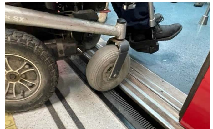
Imatge de la prova pilot del sistema Gap filler .