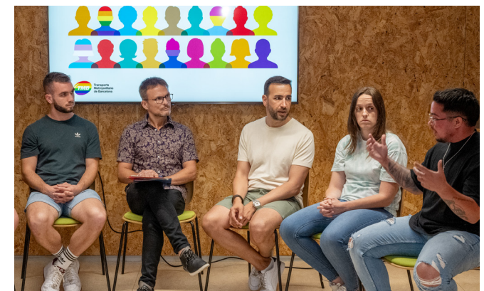
Imatge del col·loqui "TMB Orgull per la diversitat".