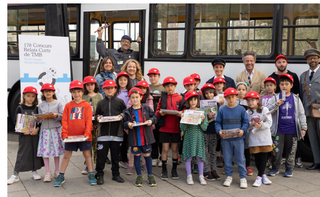
Imatges d'una de les activitats de TMB Educa.