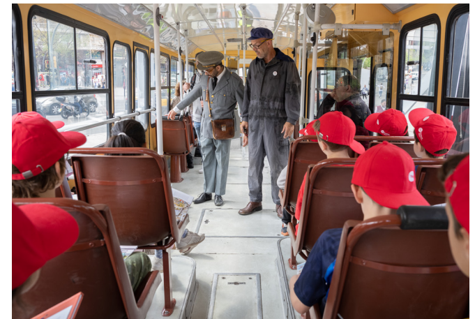
Imatge d'una de les activitats de TMB Educa.