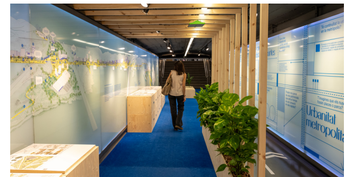
Imatges de l'exposició "Metròpolis d'avingudes" a l'Espai Mercè Sala.