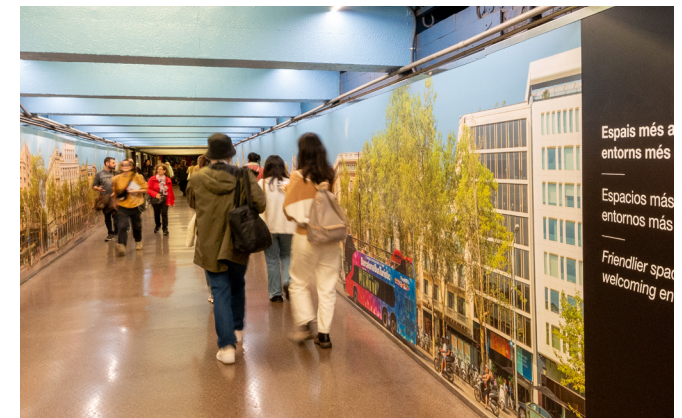
Prova pilot al passadís de Passeig de Gràcia dins el projecte "Espais més amables, espais més acollidors".