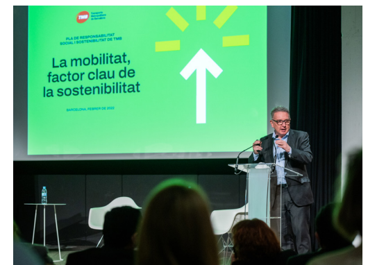
Presentació del Pla de responsabilitat social i sostenibilitat (RSiS).