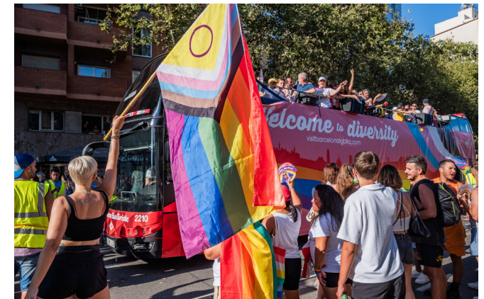
Imatge de la Pride 2023.

Peça 4. Com tractar una persona víctima de l'LGTBI-fòbia?