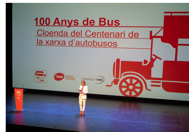
Imatge de la cloenda del centenari de bus.

El 23 maig de 2023, el Govern de la Generalitat aprova la declaració de Bé Cultural d'Interès Nacional (BCIN) de 30 elements singulars del patrimoni ferroviari català. 12 d'aquests elements pertanyen a la Fundació TMB, fet que la situa com l'entitat de Catalunya amb més béns ferroviaris catalogats d'interès nacional. Aquests vehicles són: tramvia de Cavalls n.2 (any 1888), 7 tramvies elèctrics de Tramvia Blau números 2, 5, 6, 7, 8, 10 i 129 (anys 1901-1904), primer metro del Gran Metropolità (any 1924), tramvia 867 (any 1924) i primer metro del Metro Transversal (any 1926), Tramvia elèctric 1 Mataró-Argentona (any 1928).