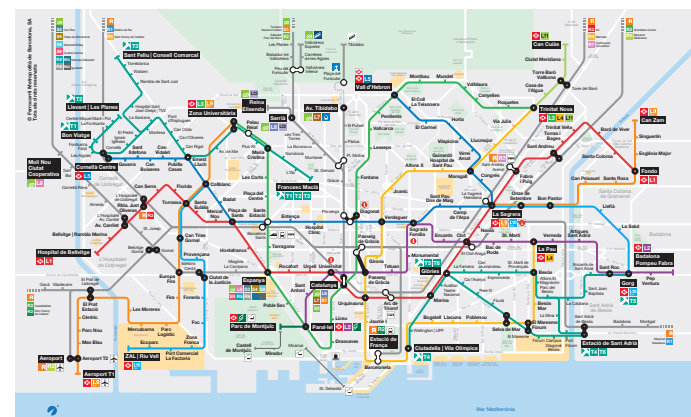
Disseny del nou plànol de metro.