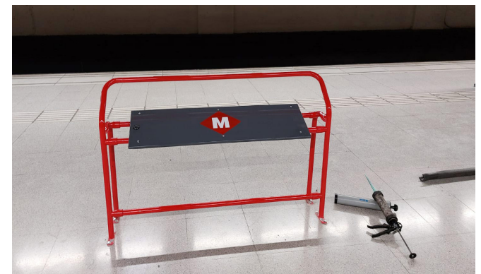
Imatge de la prova pilot del suport isquiàtic i reposabraços.