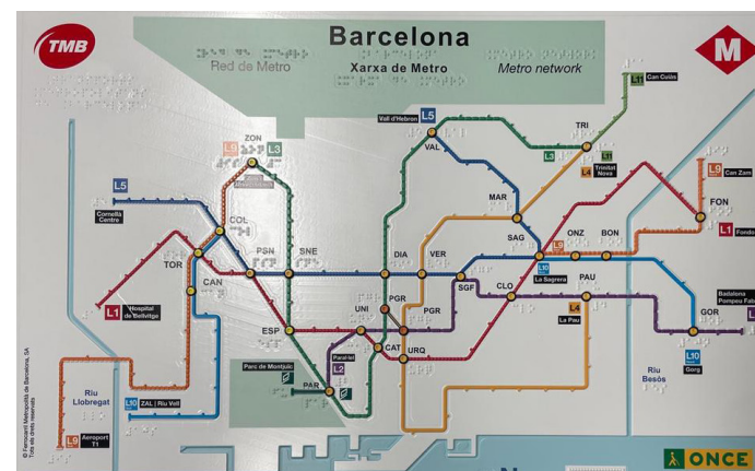
Imatges del mapa de metro en relleu.