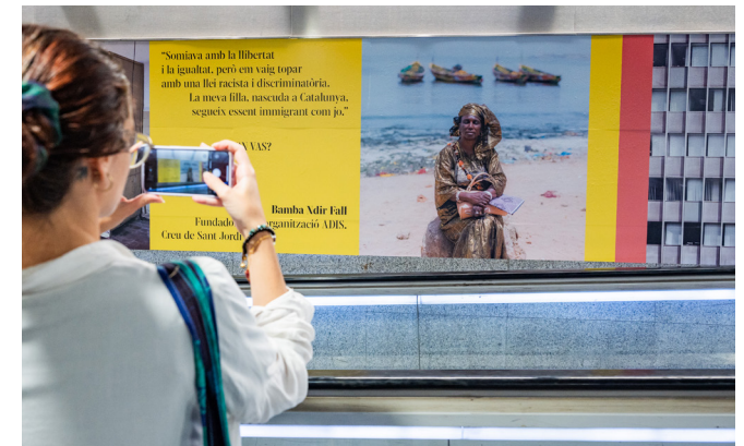
Imatge de l'exposició " On vas? Somnis en via morta ".